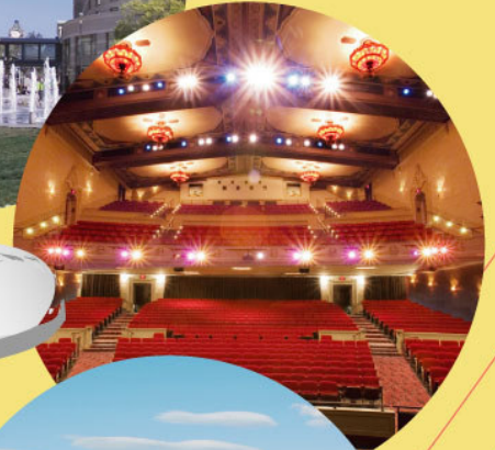
California Theatre 加州歌劇院