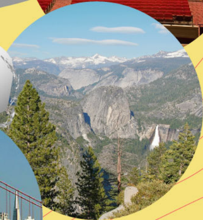
Yosemite Half Dome 優勝美地奇岩