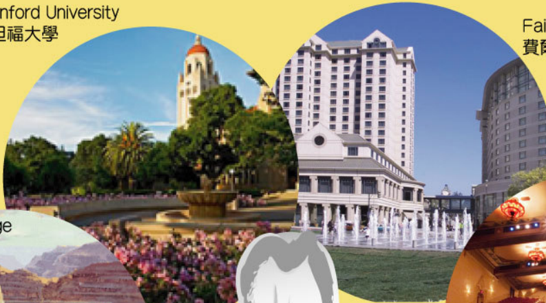
Stanford University 史坦福大學